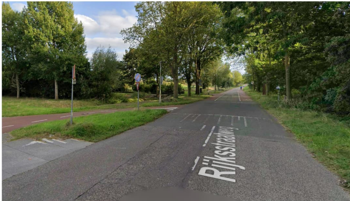
Fietspad eindigt bij het Penningpad

De fietsroute begint bij de Delfgauwseweg, waar er een vrijliggend tweerichtingenfietspad naast de weg ligt. Dit fietspad eindigt echter bij het Penningpad, vanaf waar de fietsers op een fietsstrook tussen het 60 km/u rijdende sluipverkeer moeten fietsen.