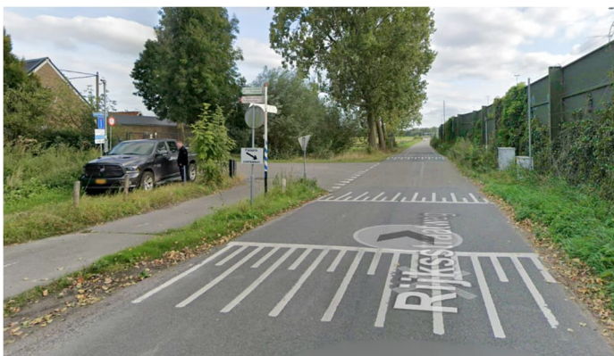
Einde van vrijliggend fietspad bij Ackerdijkseweg

Pas vanaf het Karitaatmolenpad is er weer een vrijliggend fietspad, maar dat houdt weer op bij de Ackerdijkseweg.