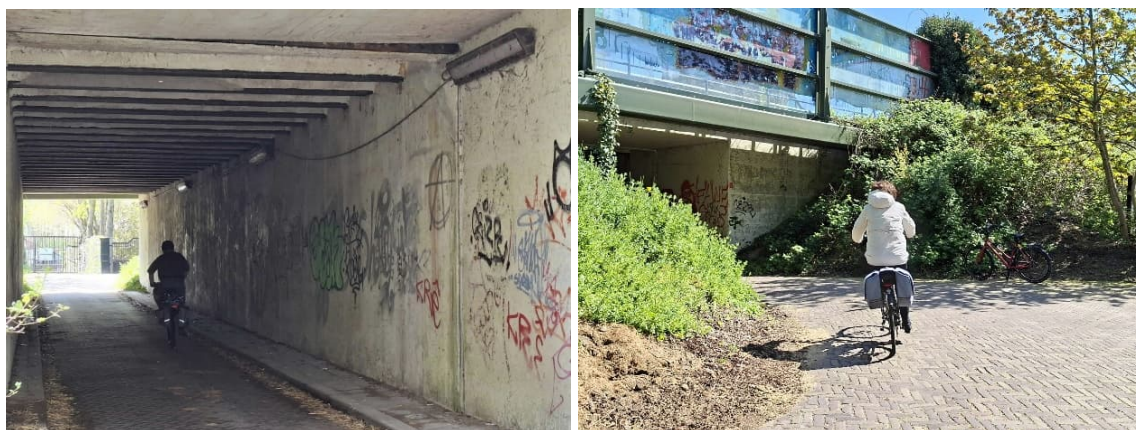
Zwethtunnel (verbinding naar o.a. de Kandelaarbrug), met onoverzichtelijke bocht als begroeiing hoger staat

Het verdient aanbeveling om de wanden te schilderen en de verlichting ook overdag aan te doen. Met verlichting zal het minder unheimisch aanvoelen. Dan zijn ook de uitwerpselen van paarden en andere rommel beter te zien en dat voorkomt last-minute uitwijkmanoeuvres. Veel fietsers gaan hier hard doorheen, omdat ze helling af aankomen. Wellicht een bord plaatsen dat hier ook auto's doorheen komen, want het suggereert een fietspad te zijn.