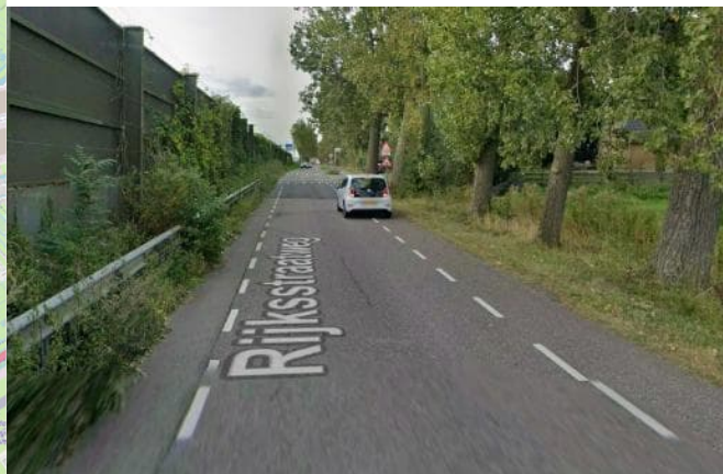
Wandelroute Natuurmonumenten (links) loopt deels over de weg waar 60 mag worden gereden (rechts)