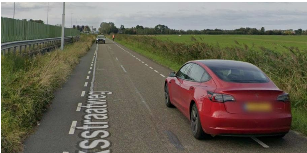
Fietzers en wandelaars komen vooral in de verdrukking als auto's elkaar tegenkomen