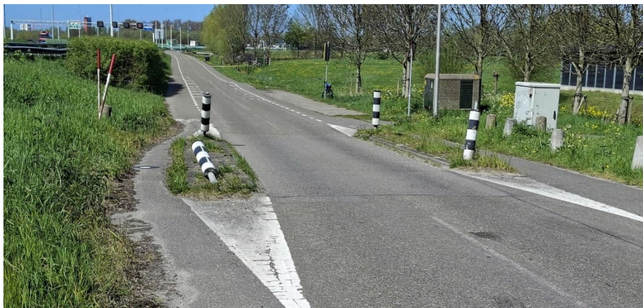
Fietsstrook in slechte staat van onderhoud tussen de Ackerdijkseweg en Zwethtunnel

De fietsstrook is in slechte staat van onderhoud op het stuk tussen de Ackerdijkseweg en de gemeentegrens van Rotterdam, zie onderstaande foto: