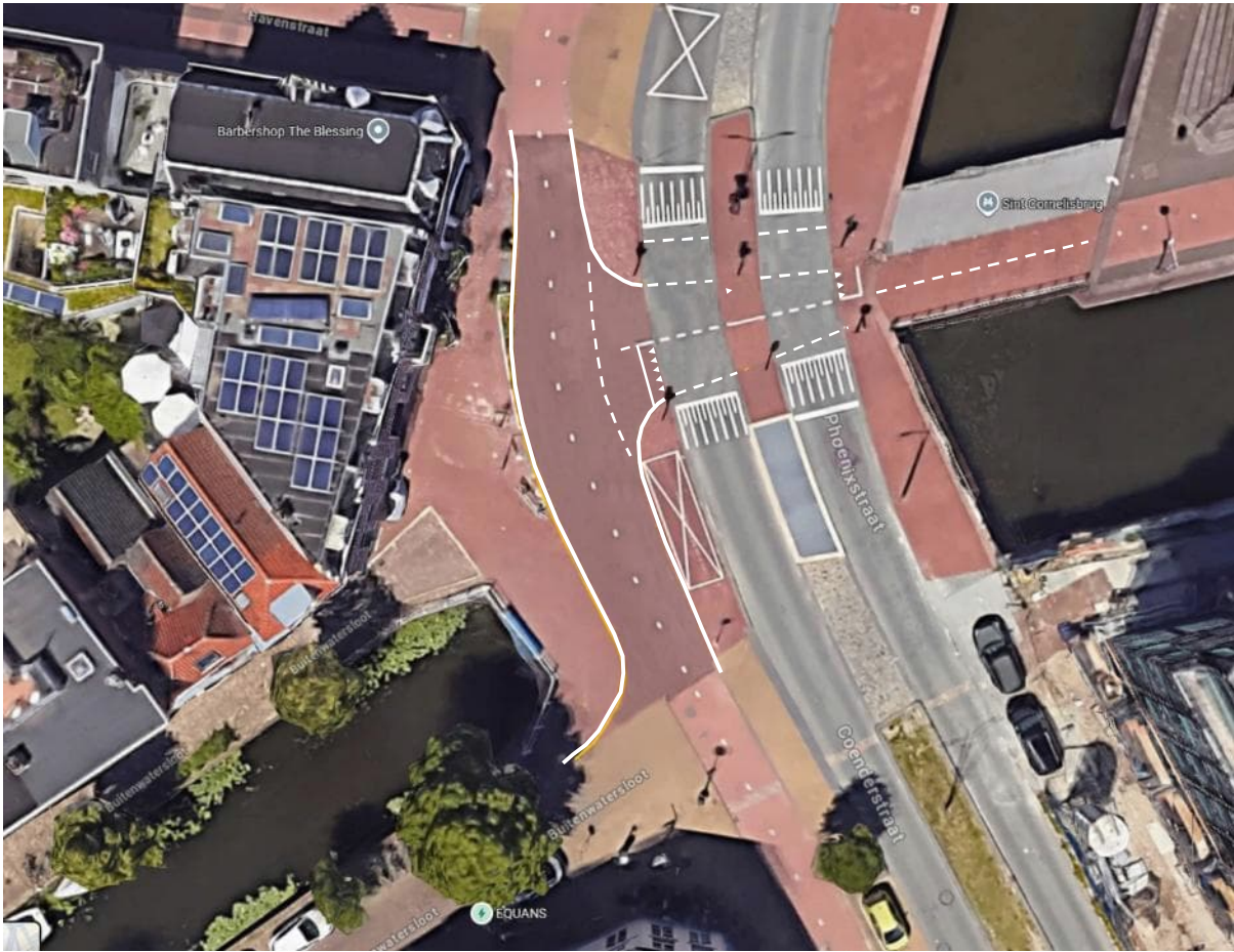
Figuur 2: Gewenste situatie met breder fietspad en rondere hoeken

De breedte van het fietspad langs de Coenderstraat tussen het Bolwerk en de Buitenwatersloot wordt hiermee 4,9 m breed, terwijl het momenteel 3,5 m is.