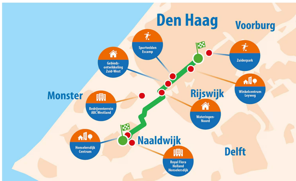
De nieuwe fietsroute moet Den Haag en Westland via Honselersdijk verbinden met elkaar.