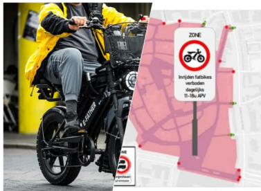
Niet vanaf 1 februari maar later geldt het fatbikeverbod.