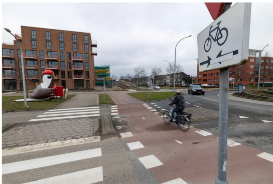
Fietsers op de rotonde in Pijnacker-Nootdorp komen van beide kanten