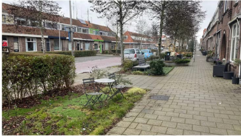
Buurttuinen aan de Constantijn Huygensstraat in Gouda