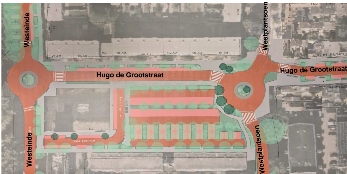
Figuur 2, Eerste variant

De rotondes zijn naar het oosten opgeschoven en de zuidelijke tak van Westplantsoen is naar het westen opgeschoven, zodat fietsers minder de neiging hebben om tegen de keer in te fietsen. Verder zijn de richels verwijderd.